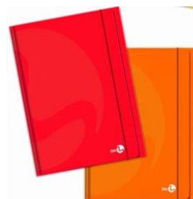
2 cartelline 25x35